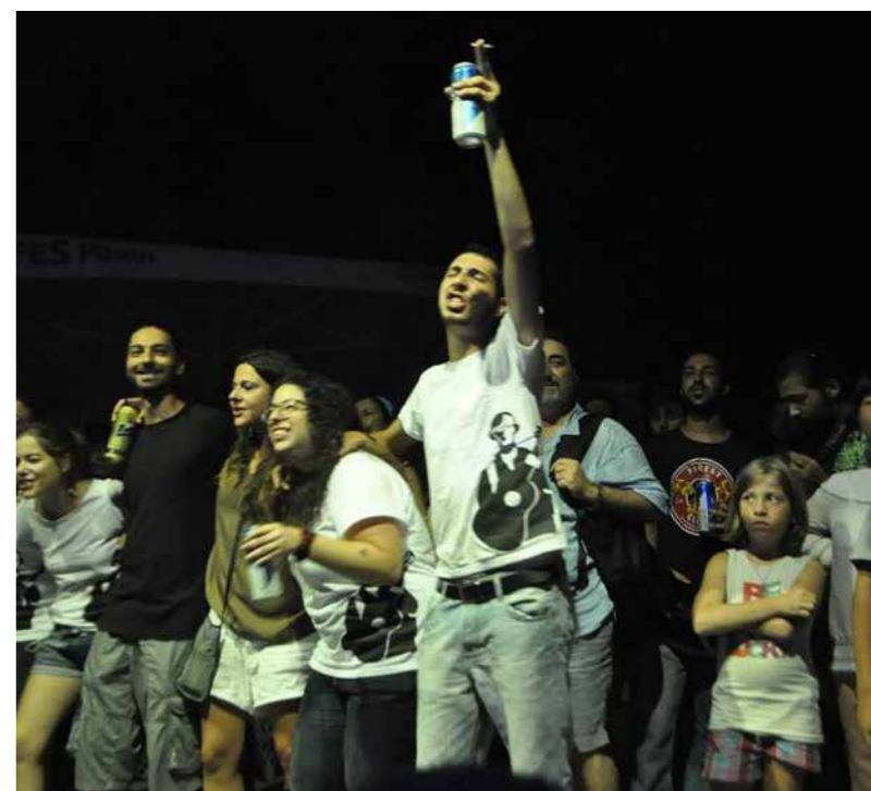
Αντιμilitarιστική Ειρηνική Επιχείρηση, 14 Αυγούστου 2013